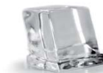
Cube Plein - 12 g (26,5 x 26,5 x 26 mm)