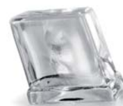
Demi Cube - 6 g (13 x 26,5 x 26 mm)